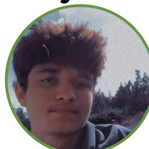
TIBERE Noa T02